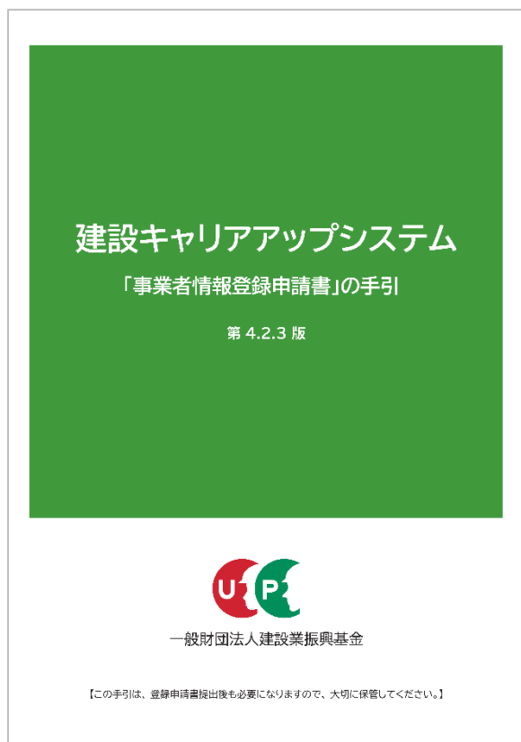
建設キャリアアップシステム 「事業者登録申請書」の手引