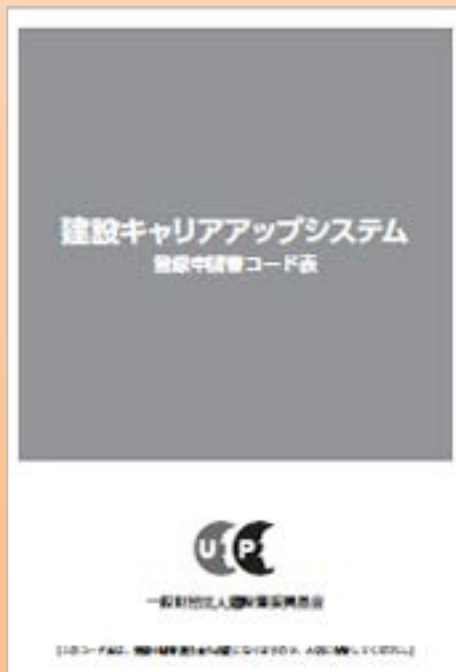
登録申請書コード表