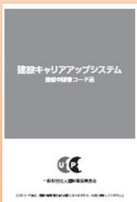
技能者のコード表